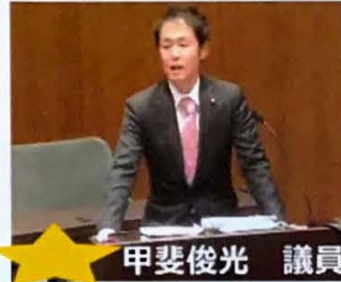
原稿を読まずに自分の言葉で質問