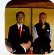
市政報告会にて多世代交流