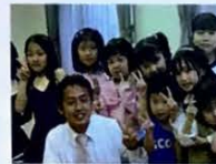
子供達の笑顔が宝物です