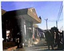
映画やドラマの 撮影を我孫子で