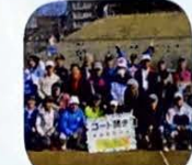
テニスクラブの仲間と