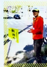
11年間続けている小学生の見守り