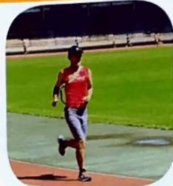
手賀沼エコマラソン12回出場